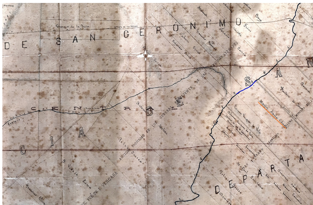
Figura 2. Recorte del plano confeccionado por el agrimensor Julián de Bustinza para el Ferrocarril del Central Argentino (1865) en el cual se indican referencias que nos permiten reducir el área de prospección. Museo de la Ciudad de Rosario Wladimir Mikielievich